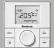
RC150 Modülasyonlu Oda Kumandası