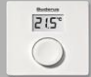
RC100 Modülasyonlu Oda Kumandası

Logamax plus GB012'nizi Buderus uzmanlığı ile üretilen oda kumandaları ile kullanın; hem doğalgaz harcamalarınızı kontrol ederek daha fazla tasarruf sağlayın hem de kombiniz konforunu daha fazla yaşayın.