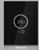
TC100 Modülasyonlu Oda Kumandası