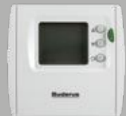
RT24RF Kablosuz Oda Kumandası