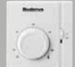
T-Control On/Off Oda Kumandası