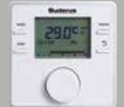
RC200RF Modülasyonlu Kablosuz Oda Kumandası